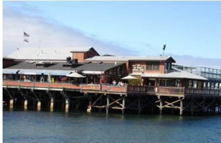
Monterey - Ca