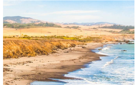
Carmel-by-the-Sea - Ca